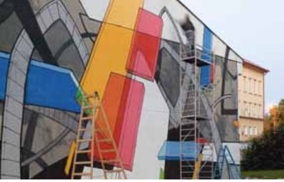
POINT při práci, Graffiti Boom 2009

V rámci festivalu vznikne v Chebu už druhá velká nástěnná malba od další výrazné osobnosti české graffiti scény: od úterý do pátku bude na zdi základní školy na Skalce malovat Masker.