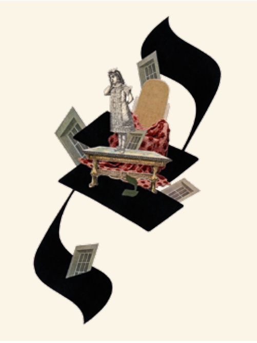
Pavel Holeka, z cyklu Hebrejská abeceda / aus der Serie Hebräisches Alphabet, koláž na papíru / Collage auf Papier, 29,7 × 42 cm