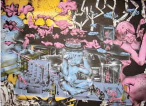
Growing up, 85 x 115 cm, 2009

Malá galerie / Kleine Galerie 26. 6.–28. 8. 2011 Kurátor / Kurator: Radek Wohlmut Vernisáž 25. června, 17.00