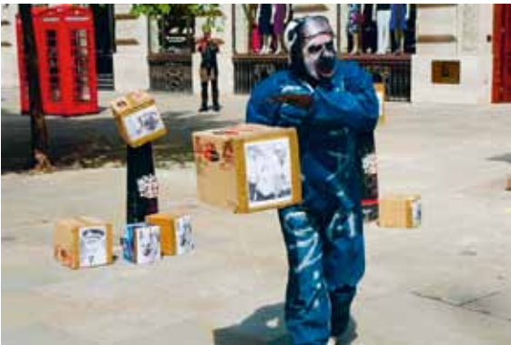
Alexis Milne, Zbraň státu / Die Waffe des Staates, 2009, video, 2:38 min. Znovooživení policejní vraždy lana Tomlinsona během demonstraci G20. Společná performance s Markem McGowanem / Das Wiederaufleben des Polizeimords an Ian Tomlinson im Verlauf der Demonstrationen zum G20-Gipfel. Gemeinsame Performance mit Mark McGowan, Royal Exchange, London

Kurátor / Kurator: Pavel Vančát Vernisáž 7. září, 17.00