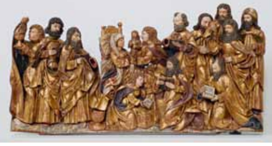
Smrt Panny Marie z kostela Povýšení sv. Kříže v Házlově, Franky nebo Horní Faic, první čtvrtina 16. století, lipové dřevo, původní polychromie / Marientod aus der Kreuzerhebungskirche in Haslau, Franken oder Oberpfalz, erstes Viertel des 16. Jahrhunderts, Lindenholz, originale Polychromie