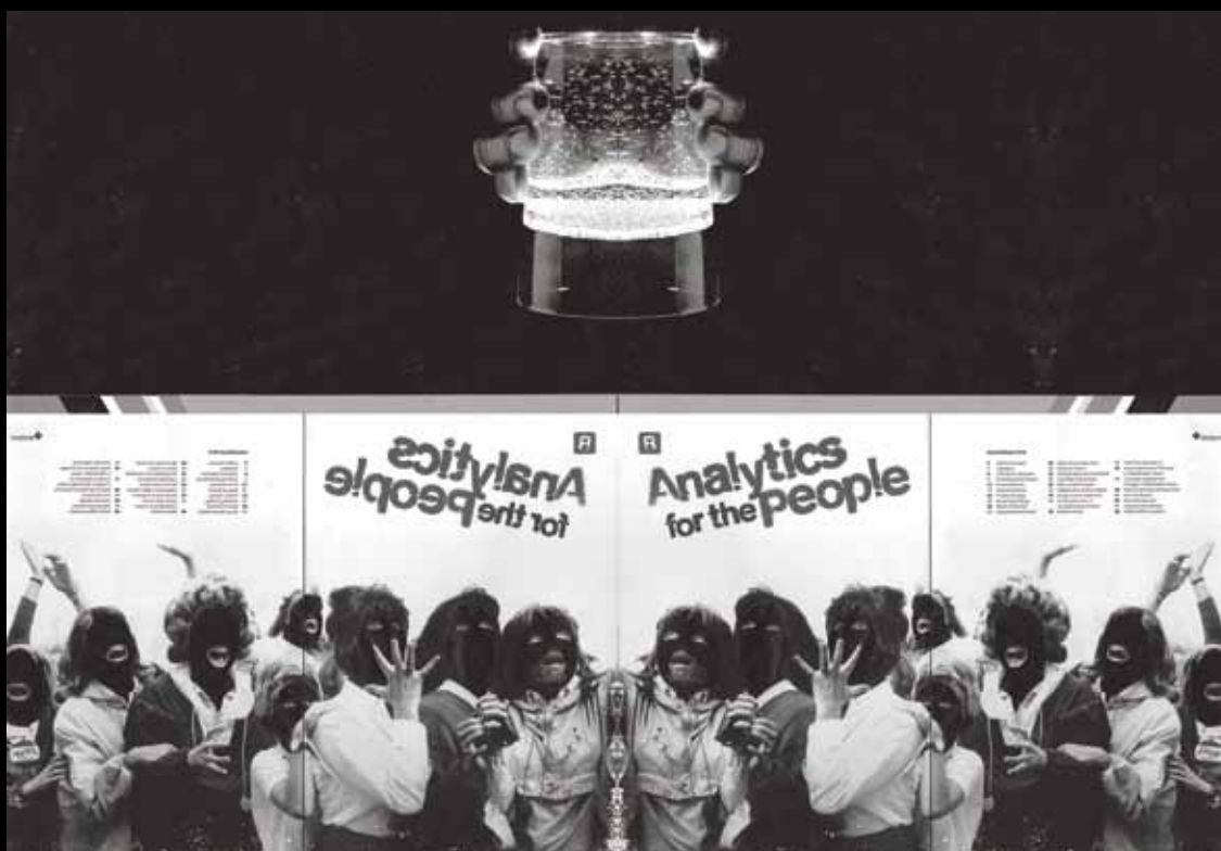
ZNOVUNABYTÁ REVOLUCE / RECUPERATING REVOLUTION, CYKLUS, 2011

Série podvrtných fotokoláží, pracující s nalezenou výroční zprávou finanční společnosti, která ve svém vizuálním stylu používá revoluční slogany a „bezpečnou“ formu protestu / A series of subverted photomontage collages utilising found financial corporate literature that uses revolutionary slogans and 'safe' counter culture imagery in its visual tone and branding.