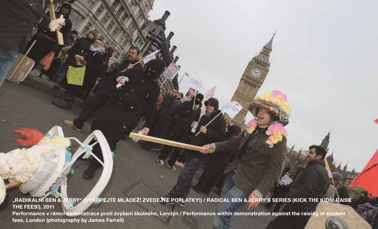
„RADIKÁLNÍ BEN & JERRY“ (VYKOPEJTE MLÁDEŽ! ZVEDEJTE POPLATKY!) / RADICAL BEN & JERRY'S SERIES (KICK THE KIDS! RAISE THE FEES!), 2011

Performance v rámci demonstrace proti zvýšení školného, Londýn / Performance within demonstration against the raising of student fees, London