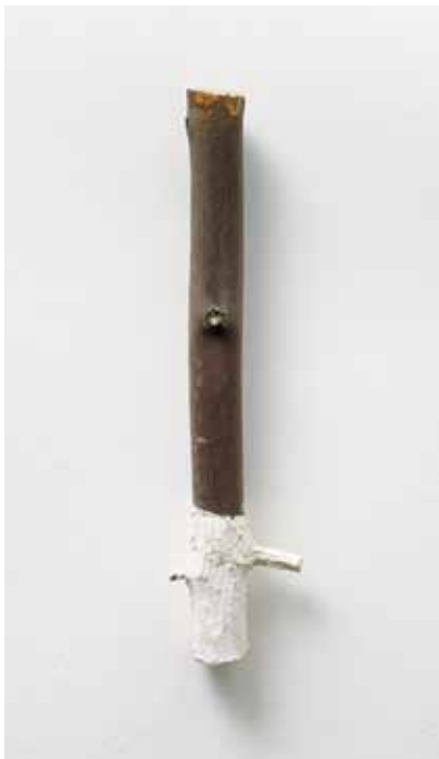
Bez názvu / ohne Titel, 1996, dřevo, disperze / Holz, Dispersion, 44 cm, Wannieck Gallery Brno