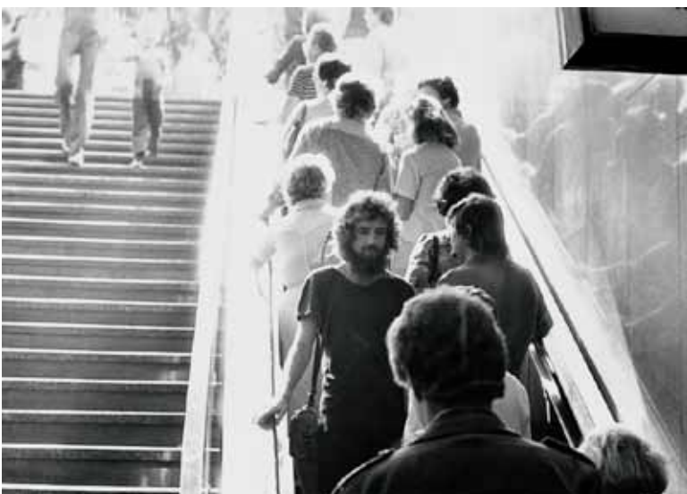
Bez názvu / ohne Titel, 3. 9. 1977, Praha, Václavské náměstí / Prag, Wenzelsplatz. Na eskalátoru... otočen hledím do očí člověku, který stojí za mnou... / Auf der Rolltreppe... umgewendet schaue ich dem Menschen, der hinter mir steht, in die Augen...

Galerie výtvarného umění v Chebu 13. 1.–3. 4. 2011, vernisáž 12. 1. 2011, 17.00