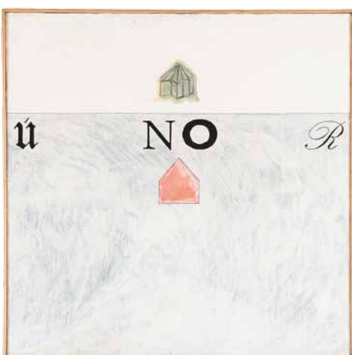
Poesie a politika / Poesie und Politik, 1988, disperze, tuš, plátno / Dispersi-on, Tinte, Leinwand, 120 x 120 cm, Galerie hlavního města Prahy