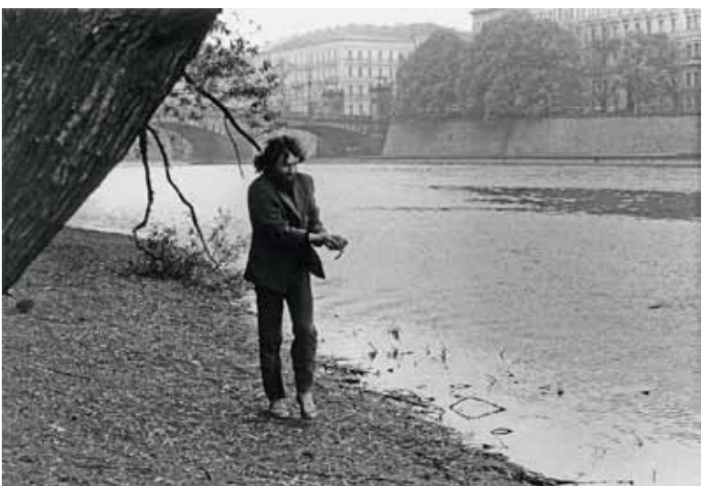
Bez názvu / ohne Titel, 19. 5. 1977, Praha / Prag, Střelecký ostrov. Vodu z řeky přenáším v dlaních o několik metrů dál po proudu... / Ich trage Wasser aus dem Fluss in den Händen einige Meter weiter flussabwärts...