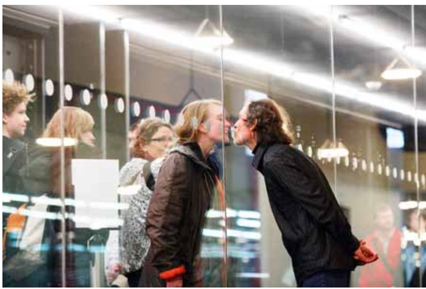
Libání přes sklo / Küssen durch das Glass, 10. 3. 2007, Tate Modern, Londýn / London