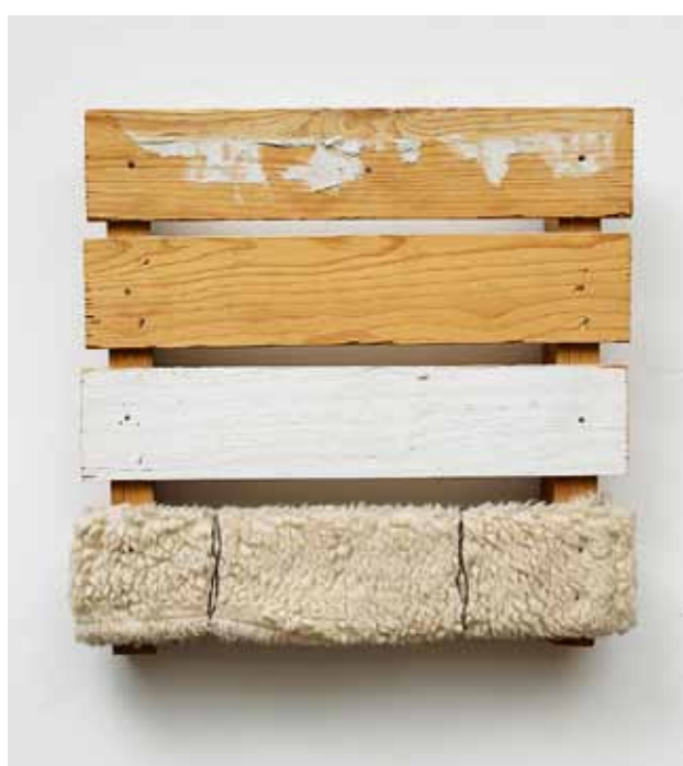
Bez názvu / ohne Titel, 1990, dřevo, disperze, překližka, umělá kožešina / Holz, Dispersion, Sperrholz, Kunstpelz, 40 x 40 cm, Wannieck Gallery Brno