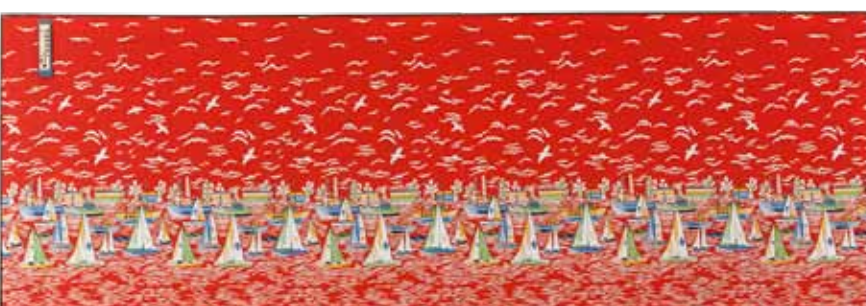
Bez názvu / ohne Titel, 1986, látka, teploměr, rám / Stoff, Thermometer, Rahmen, 80 x 230 cm

Po roce 1989 Kovanda systematicky rozvíjel svou předchozí tvorbu. Jestliže v osmdesátých letech prováděl drobné intervence do veřejného prostoru, kterých si nikdo nemohl všimnout (např. Věž cukru tvoří několik kostiček cukru postavených u zdi domu) a už vůbec ne je vnímat jako umění a kde právě tato skrytost byla důležitou součástí jejich poetiky, nyní tento princip obrací. Do galerijního prostředí, které automaticky „mění“ vše zde prezentované v umění, přináší nejrůznější kusy prkének, destiček a větví. Vždy je ovšem lehce posune: půlku větve natře na bílo, k obyčejné lopatce připevní stejně obyčejný provázek. Vedle toho pokračuje ve starších pracovních postupech, jako jsou zmíněné nenápadné intervence do veřejného prostředí („zazděné“ sušenky na Prague Biennale 2 v Praze - Karlíně) nebo performance na téma nonverbální komunikace (Libání přes sklo, Tate Modern, London, 2007). Jeho práce si podržela několik základních rysů - minimalistickou estetiku, jistou primitivnost vytváření vyhýbající se jakémkoliv virtuozitě, citlivost pro všední věci a jemné posuny vztahů... Často vystavuje pro mladými výtvarníky, kteří jej považují za respektovaný a inspirativní vzor, na druhou stranu pro mnoho tradičněji orientovaných tvůrců se stal symbolem toho, jak dnes kurátoři manipulují uměním, když něco takového mohou přezentovat jako umělecké dílo. Ale právě tento riskantní pohyb „na hranicích umění“, jak to kdysi nazval Jindřich Chaloupecký, je charakteristickým znakem Kovandova umění.