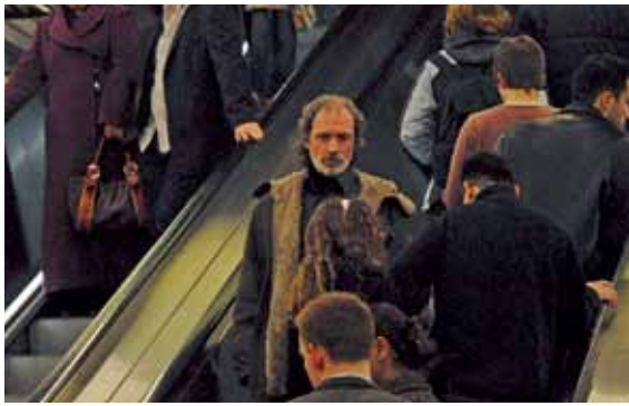
Bez názvu / ohne Titel, 10. 3. 2007, Tate Modern, London, remake akce / Neugestaltung der Aktion