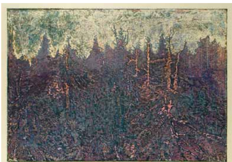
Mrtvý les / Der Tote Wald, 1931, barevný dřevoryt / farbiger Holzschnitt, z knihy Šumava umírající a romantická / aus dem Buch Böhmerwald sterbend und romantisch, Muzeum Šumavy Sušice