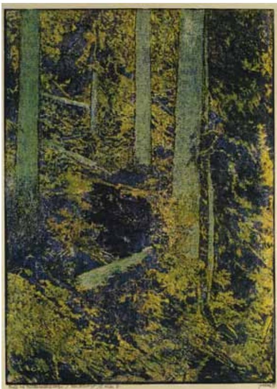
Prales na Höllenbachsprengu / Urwald am Höllenbachspreng, 1931, barevný dřevoryt / farbiger Holzschnitt, z knihy Šumava umírající a romantická / aus dem Buch Böhmerwald sterbend und romantisch, Muzeum Šumavy Sušice