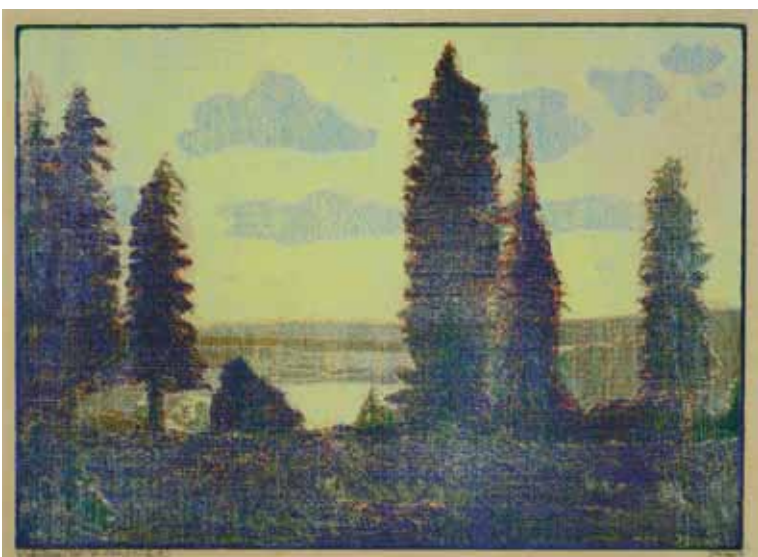
Slaf Weitfällernská / Das Weitfällernfilz, 1931, barevný dřevoryt / farbiger Holzschnitt, z knihy Šumava umírající a romantická / aus dem Buch Böhmerwald sterbend und romantisch, Muzeum Šumavy Sušice