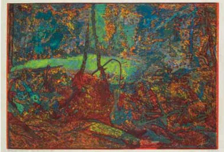
Rankelské rašeliniště / Rankelmoor, 1931, barevný dřevoryt / farbiger Holzschnitt, z knihy Šumava umírající a romantická / aus dem Buch Böhmerwald sterbend und romantisch, Muzeum Šumavy Sušice