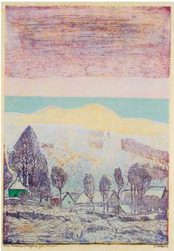
Zima v Pošumaví – Strážovice / Winter im Böhmerwaldvorland – Strážovice, 1931, barevný dřevoryt / farbiger Holzschnitt, z knihy Šumava umírající a romantická / aus dem Buch Böhmerwald sterbend und romantisch, Muzeum Šumavy Sušice