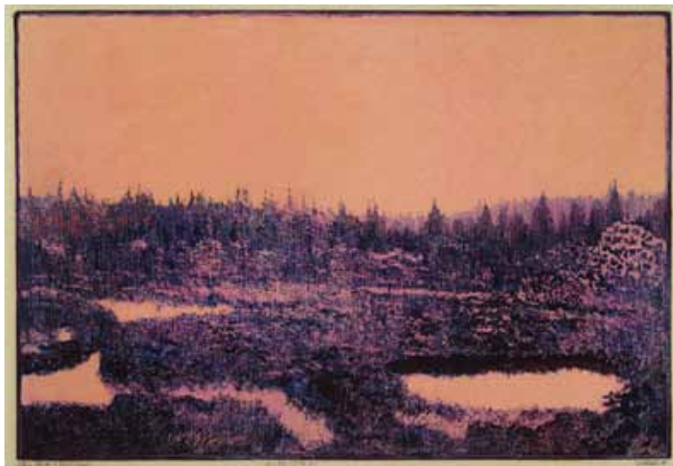
Oka slatí Neuhütten / Mooraugen in Neuhütten, 1931, barevný dřevoryt / farbiger Holzschnitt, z knihy Šumava umírající a romantická / aus dem Buch Böhmerwald sterbend und romantisch, Muzeum Šumavy Sušice