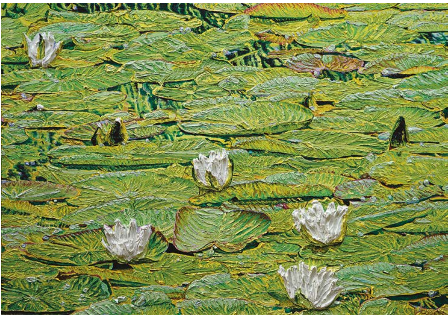
Nymphaea alba, 2023, 120×170 cm, olej na plátně / Öl auf Leinwand