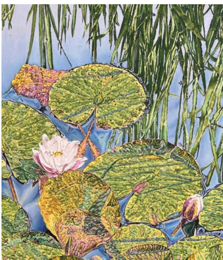
Königshain, 2024, 105×90 cm, olej na plátně / Öl auf Leinwand

Katharina Gierlach, Refugium GAVU Cheb, Malá galerie / Kleine Galerie 10. 4.–22. 6. 2025 Kurátorka / Kuratorin Kirsten Remky Otevírací doba / Öffnungszeiten: út – ne / Di – So 10.00–17.00