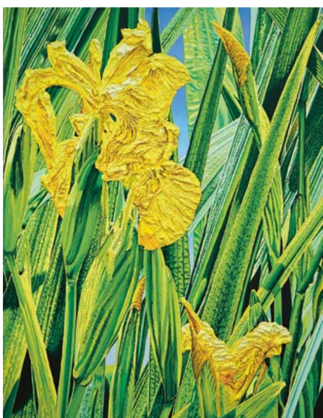
Kosatec žlutý / Sumpf-Schwertlilie (Iris pseudacorus), 2023, 180×140 cm, olej na plátně / Öl auf Leinwand

Katharina Gierlach findet die Motive ihrer Seerosenbilder in Parkanlagen, Naturschutzgebieten und privaten oder botanischen Gärten. Seerosenteiche bieten Rückzugsorte für Besucher und dienen als Schutzzonen für Pflanzen. Schönheit und Ruhe strahlen die auf dem Wasser treibenden Blüten aus. Seerosen sind Wassergewächse mit der Besonderheit, dass sie den Grenzbereich Erde, Wasser und Luft verbinden und mit positiver Symbolik verhaftet sind. Der botanische Name „Nymphaea“ leitet sich aus der antiken Mythologie ab, die die Verwandlung einer Nymphe in eine Seerose beschreibt.