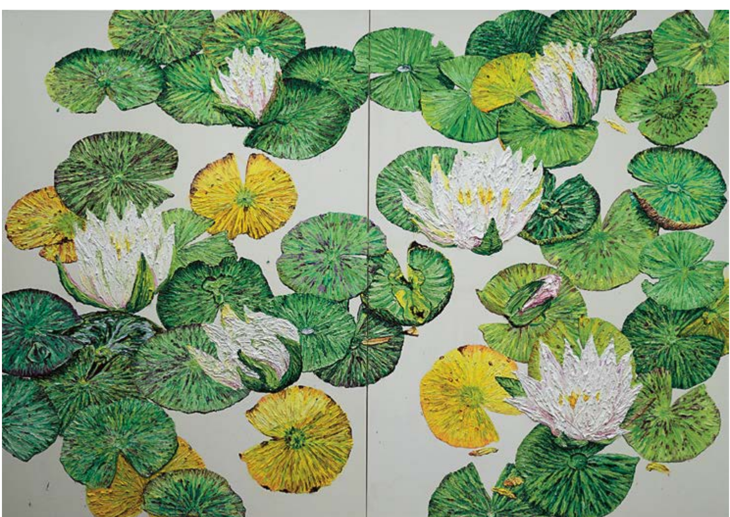
Texas Dawn, 2018, 2×170×120 cm, olej na plátně / Öl auf Leinwand