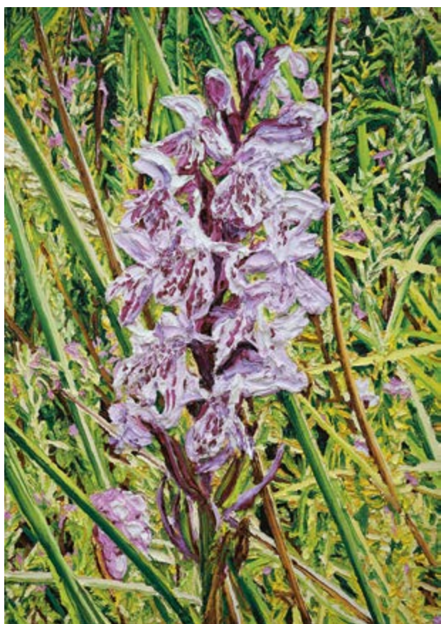
Dactylorhiza maculata, 2022, 170×120 cm, olej na plátně / Öl auf Leinwand