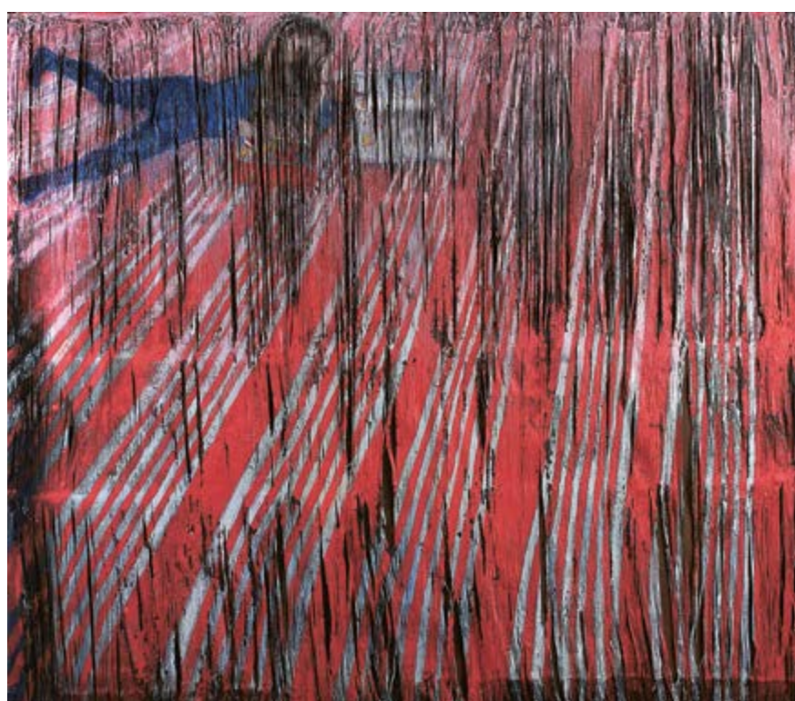
Fixy / Markers, 2008, akryl na párané riflovině / acrylic on ripped denim, 145×175 cm, soukromá sbírka/ private collection