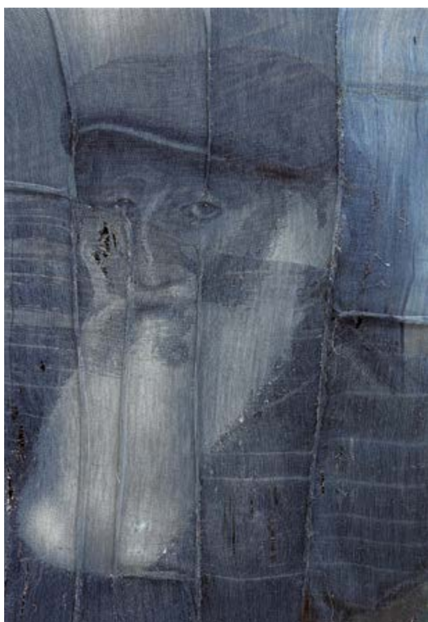
Pissarro, 2019, akryl na párané riflovině / acrylic on ripped denim, 110×75 cm, soukromá sbírka / private collection