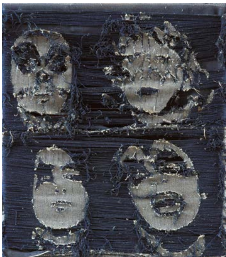
Kissáci / Kiss, 1996, páraná riflovina / ripped denim, 40×35 cm, soukromá sbírka / private collection