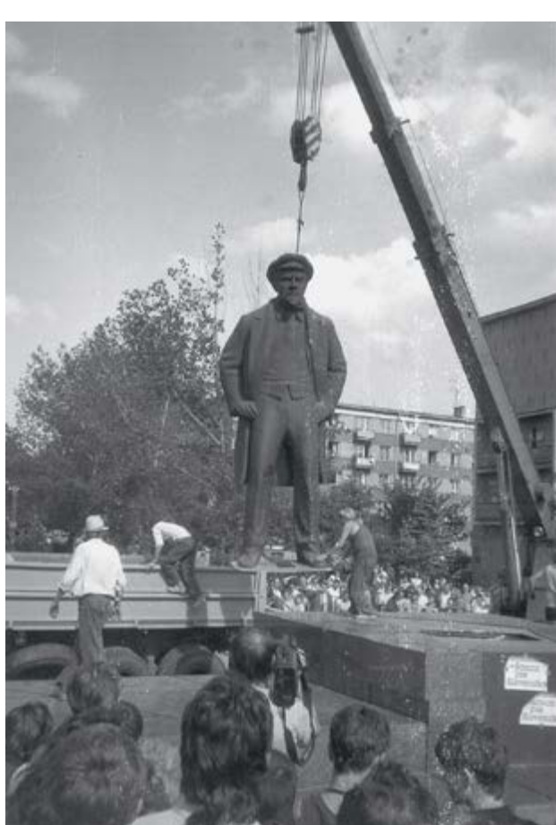
Odstraňování Lenina pomníku v Banské Bystrici 17. 5. 1990

Umělecké zpodobňování Lenina, Stalina či Gottwalda tvořilo neodmyslitelnou součást propagandy minulého režimu, a to součást velmi dravou a nepřehlédnutelnou. Lukrativní ideologické zakázky se pak pro řadu umělců staly vítaným zdrojem příjmů i kariérním výtahem do přízné mocných a veřejný prostor v poválečném Československu byl doslova okupován nejrůznějšími figurálními pomníky „největších synů dělnické třídy“. Zdánlivě sterilní masová produkce podobizen komunistických pohlavárů však při bližším zkoumání vykazuje zajímavé kličky a zákruty, které byly často odvislé přímo od kremelského politického barometru. Výstava zachycuje „život“ prorežimních pomníků od jejich vzniku přes fázi bujarých festivit až po překotné odstraňování z veřejného prostoru po roce 1989 a živoření po skladištích a depozitářích v letech následujících. Mají nám tato díla dnes ještě vůbec co říct? Jde o umělecky bezcenné harampádí, či významný doklad doby svého vzniku? Jak s nimi optimálně naložit, aby zůstaly mementem totalitních časů?