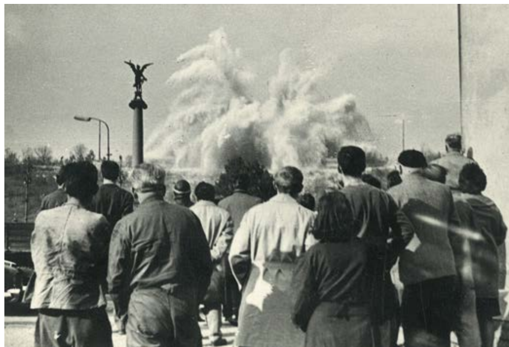
Odstřel Stalinova pomníku v Praze na podzim 1962

Sraz občanstva je na nábřeží proti pomníku.