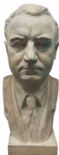
Gottwaldova busta od Otakara Švece