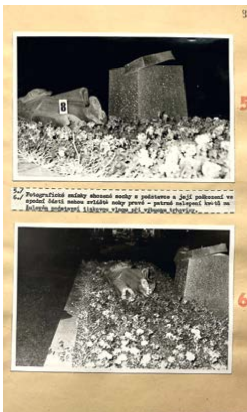
Dokumentace bombového útoku, Archiv bezpečnostních složek, sbírka Správa vyšetřování StB – vyšetřovací spisy, arch. č. V-29083 MV