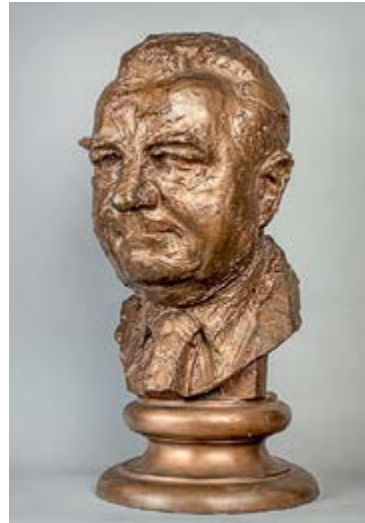
Vincenc Makovský, Podobizna K. Gottwalda, 1950, bronz, MG Brno