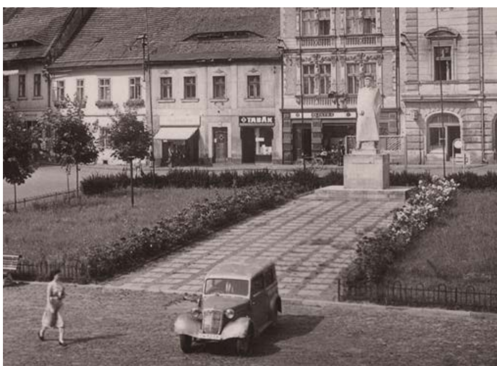
Náměstí ve Cvikově s pomníkem J. V. Stalina (dobová pohlednice)