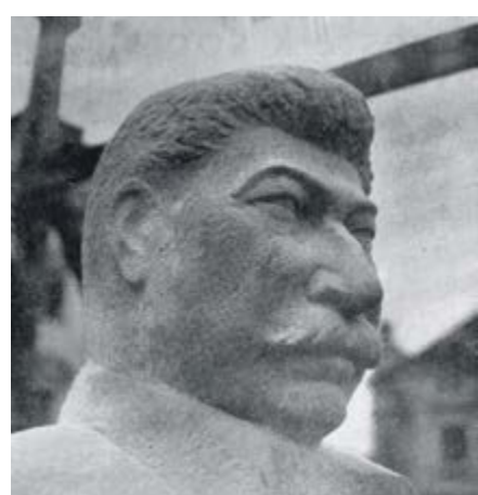
Detail Stalinovy podoby na cvikovském pomníku (Stráž severu, 7. 11. 1948)