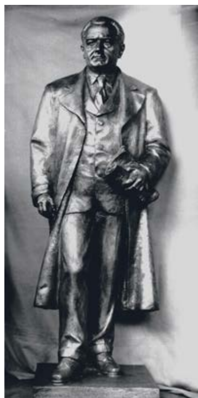
Břetislav Benda, pomník K. Gottwalda v Příbrami, NA, f. MK ČSR/ČR, sign. 30 Příbram – IR, kart. 198, nezprac.