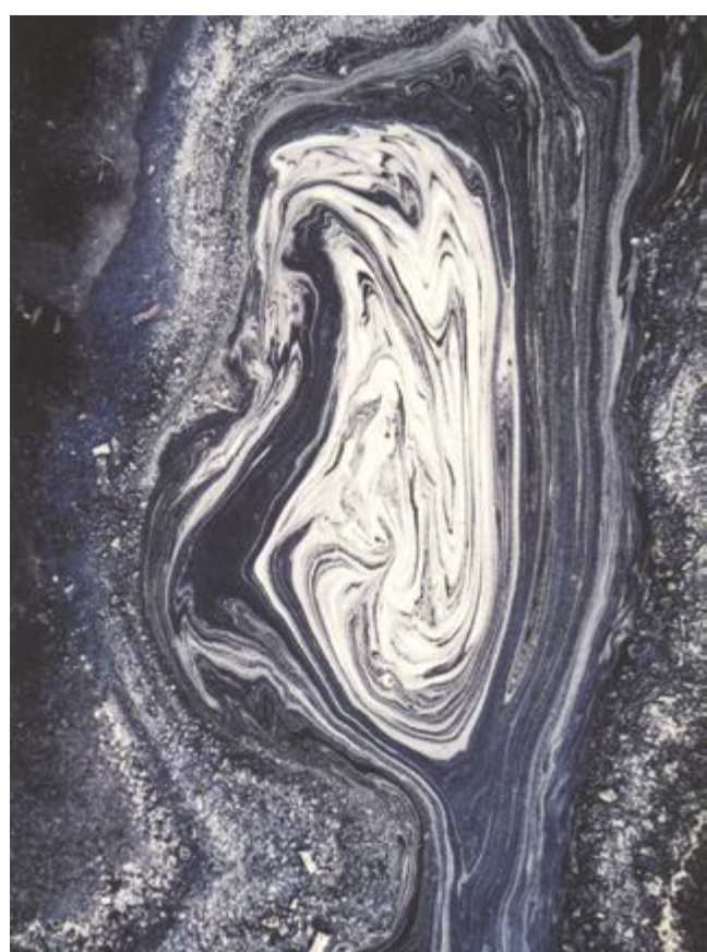
Svět pod nohama