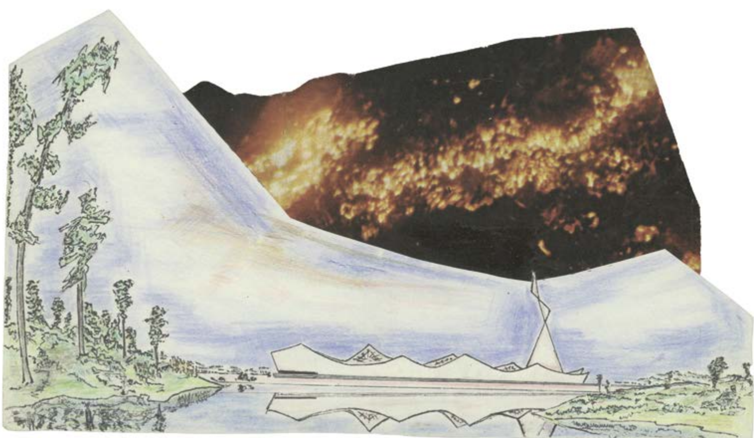
Katedrála; Jihozápadní země, 1969