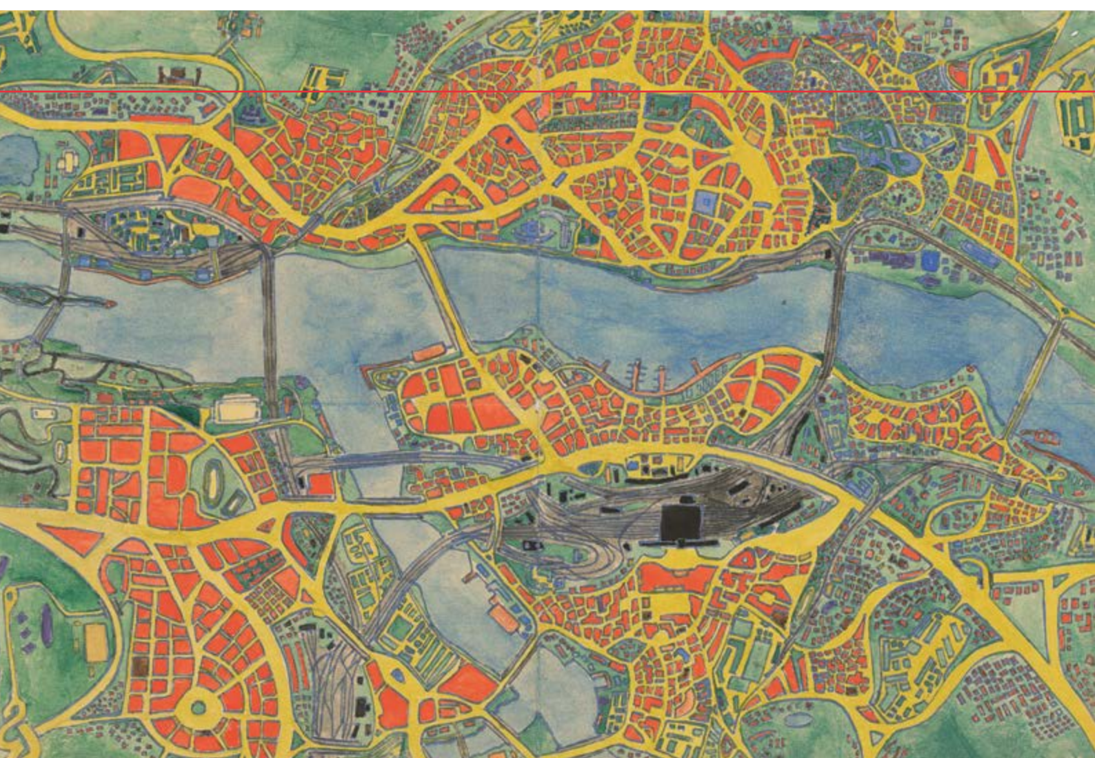
Bratislava – Město; Slovenská země, 1965

* Názvy v tradičním slova smyslu svým dílům Pavel Salák nedává. Přiřazené popisky tedy obsahují spíše kartografickou informaci, co je vlastně na jednotlivém obraze či na fotografii zachyceno. Tento princip platí jak u snímků reálných krajín, tak u maleb Salákových imaginárních měst. Zde neuvádíme ani techniku, většinou se jedná o temperu a barevné tuše na papíru. U řady fotografií Ztracené země se nepodařilo dohledat letopočet, kdy byly pořízeny, proto od vročení ustupujeme.