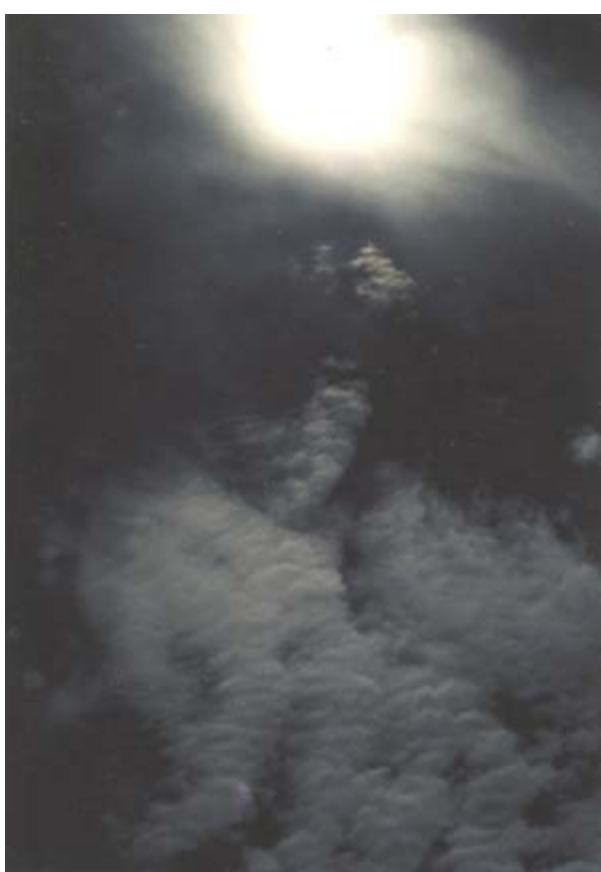
Svět nad hlavou