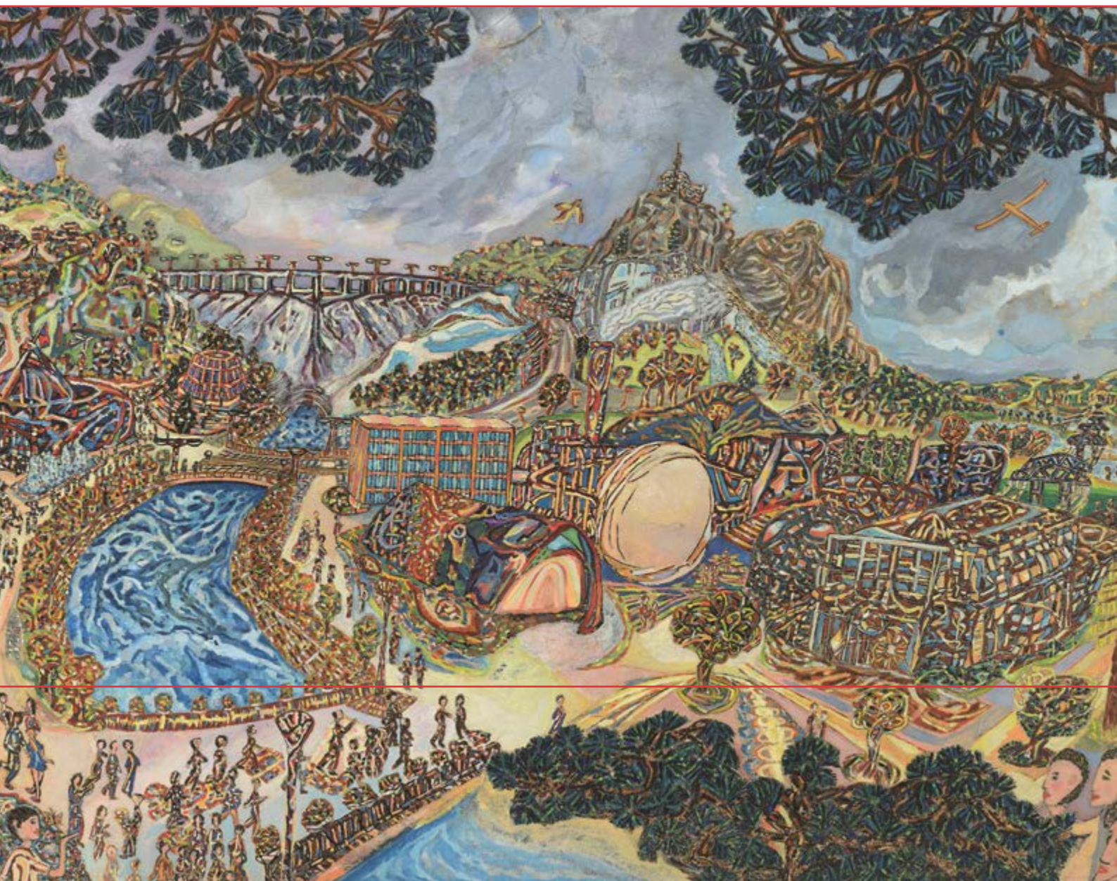
Výzkumné středisko termonukleárních reakcí; pomezí zemí Karlovy Vary, Ostrov a Severovýchod. 1979

* Názvy v tradičním slova smyslu svým dílům Pavel Salák nedává. Přiřazené popisky tedy obsahují spíše kartografickou informaci, co je vlastně na jednotlivém obraze či na fotografii zachyceno. Tento princip platí jak u snímků reálných krajín, tak u maleb Salákových imaginárních měst. Zde neuvádíme ani techniku, většinou se jedná o temperu a barevné tuše na papíru. U řady fotografií Ztracené země se nepodařilo dohledat letopočet, kdy byly pořízeny, proto od vročení ustupujeme.