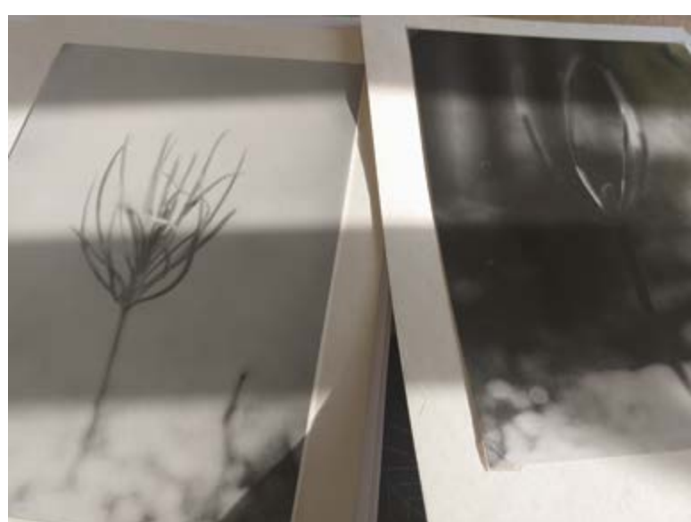
Borovice blatka, sazeničky