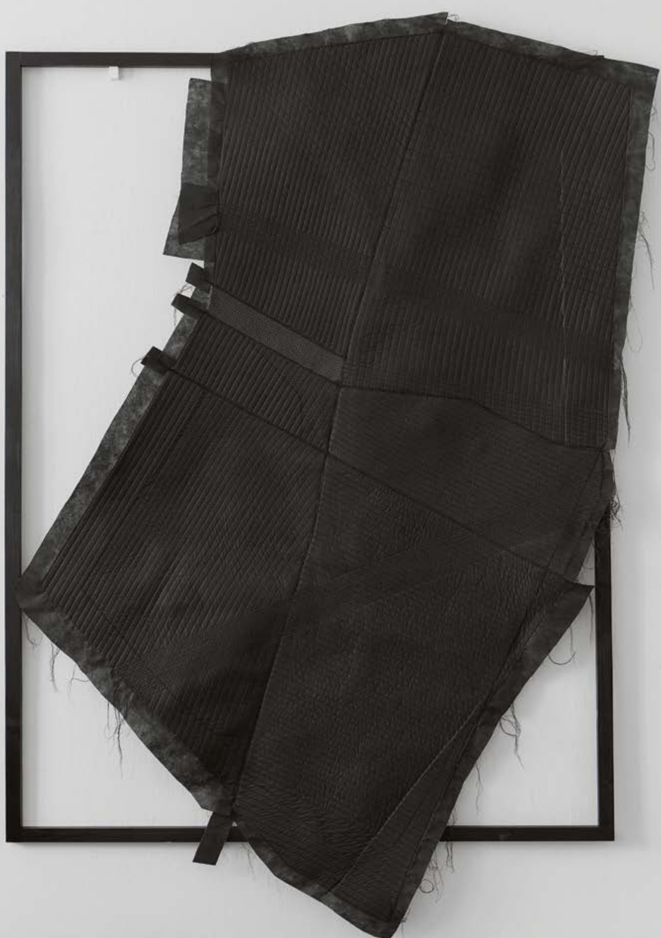
Geotextilie prošívaná ručně a šicím strojem, 2024, 150 x 105 cm