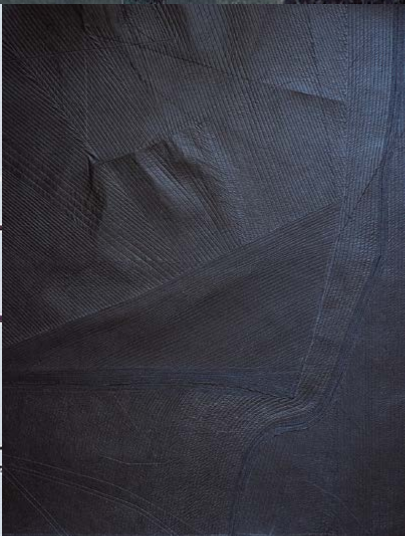
Podkladový materiál, ortofotomapa Kejnice, 2020 Podkladový materiál, skica, katastrální mapa Kejnice, 2024 Geotextilie prošívaná ručně a šicím strojem, 2022, 130 x 110 cm