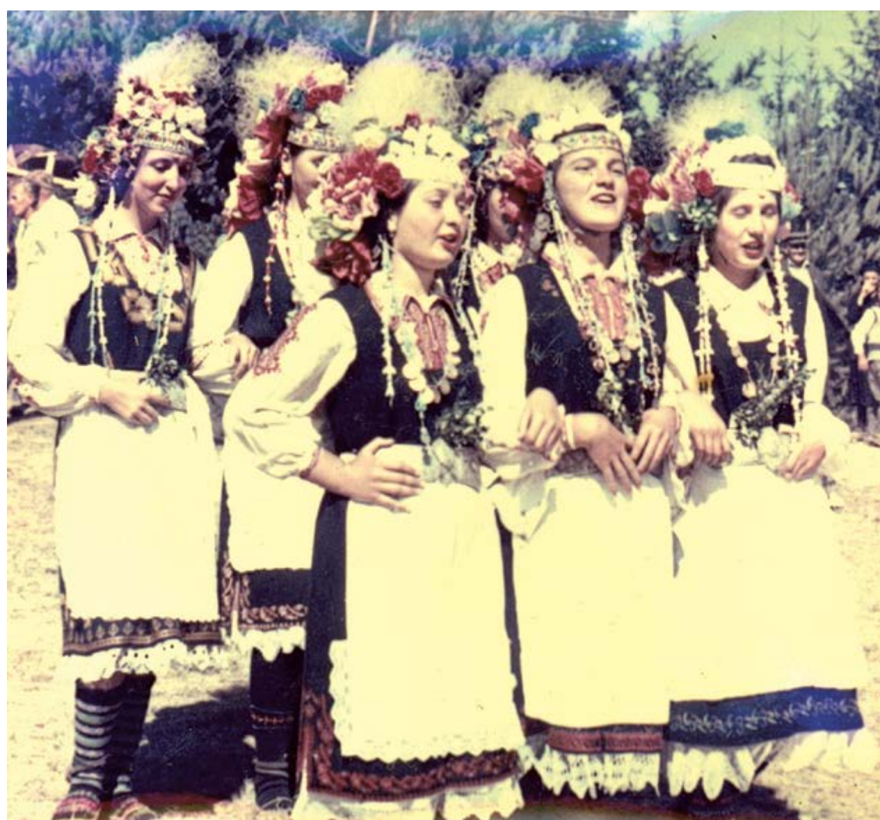
Lazarky v okolí Sofie, druhá polovina 20. století, fotografie, Regionální etnografické muzeum v Plovdivu

stavním formátu opus magnum v Galerii výtvarného umění v Chebu. Není datován, lze se však domnívat, že vznikl kolem roku 1902. Z tohoto roku pochází jeho druhá verze, jež se dnes nachází v soukromé Galerii Džurkovi v Plovdivu. 2 Obě práce jsou si velmi blízké, liší se pouze podobou stromu, který je na pražské verzi zobrazen jako kvetoucí. Tento detail má i své obsahové konsekvence, neboť zobrazený motiv těsněji spojuje s obdobím, k němuž se nedílně váže, jak o tom bude pojednáno dále.