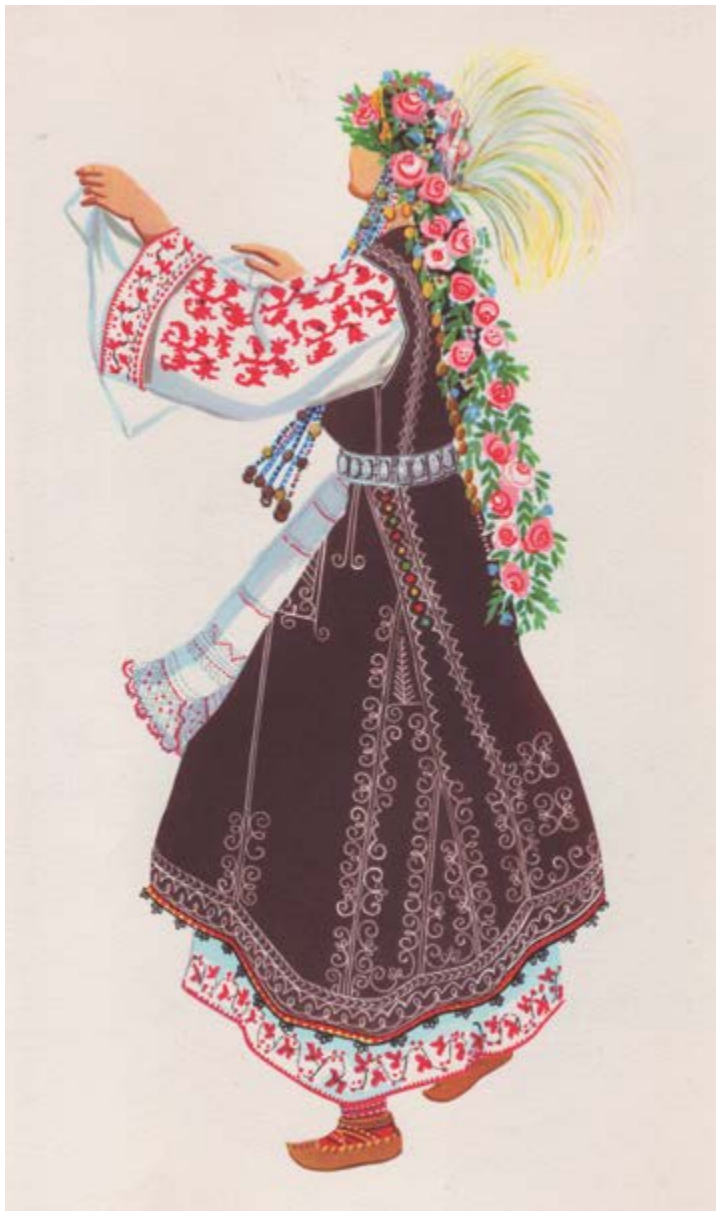
Dívka v lazarském kroji, okolí Sofie, převzato z Bulharské národní kroje a výšivky , 1951