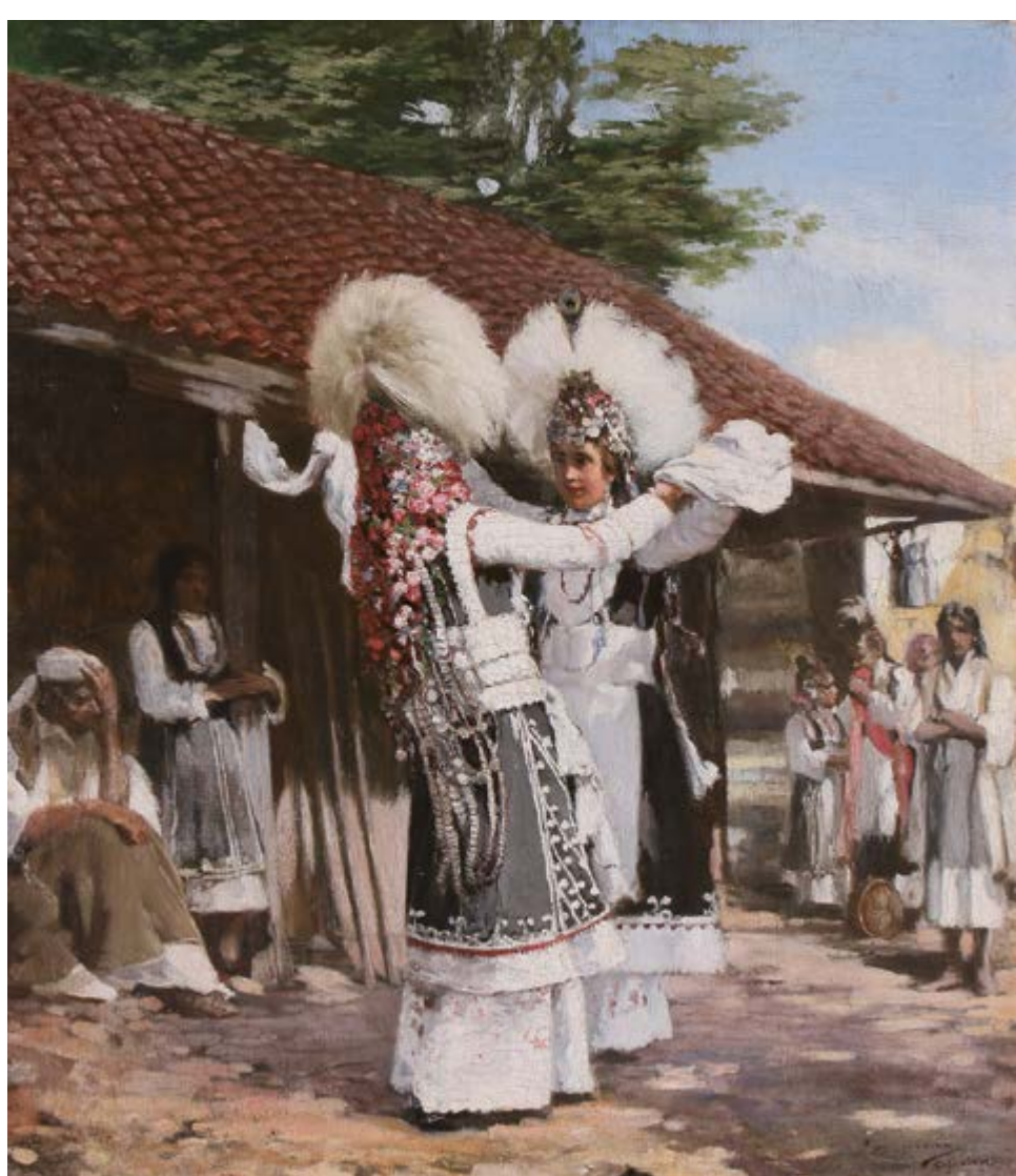
Jan Václav Mrkvička, Lazarky, 1902, olej na plátně, 64 × 58 cm, Galerie Džurkovi, Plovdiv

Zakladatelskou postavou moderního bulharského umění je český malíř Jan Václav Mrkvička (1856–1938), který v Bulharsku používal křestní jméno Ivan. 1 Během téměř čtyřiceti let zde vytvořil velký počet uměleckých děl včetně monumentálních chrámových maleb, jako učitel vychoval řadu malířů, uspořádal množství výstav a zejména svými díly přispěl k formování identity bulharského národa v období zrodu bulharské státnosti. Dokládá to i obraz Lazarky ze soukromé sbírky v Praze, který nyní prezentujeme ve vý-