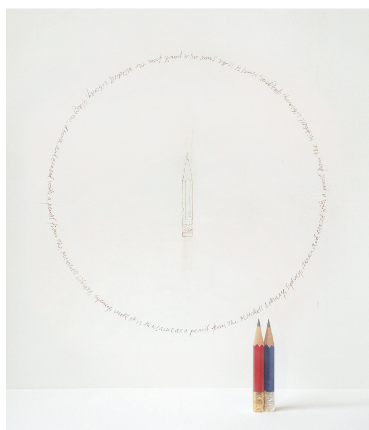
Krátké povídky (Mitchellova knihovna), 2000, tužka na papíře, 30,5 × 30,5 cm, nalezené tužky