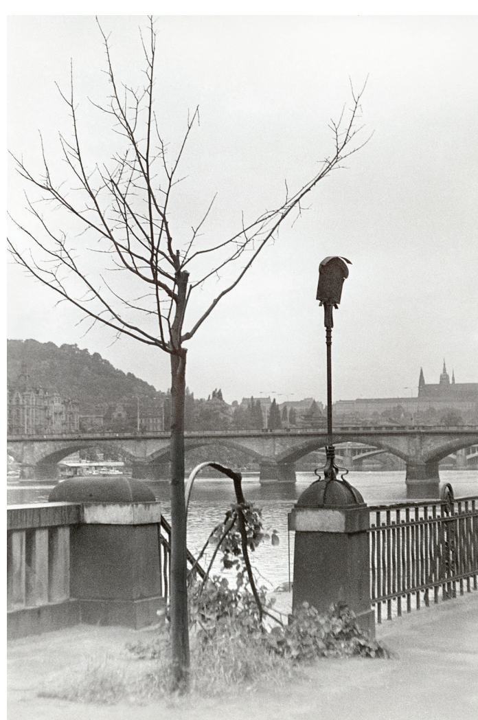
Lípa, 1980, fotografie, 28 × 40 cm