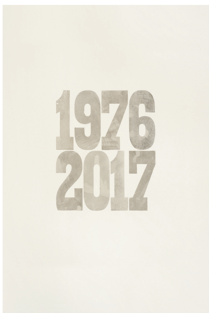
Zatímco jsi byl pryč, 2017, knihtisk prachem na papíře, 40 × 60 cm