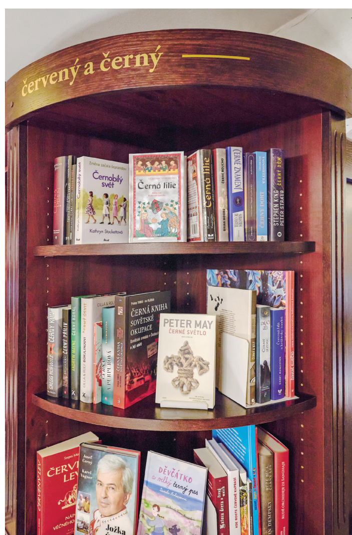
Červený a černý, 2023, intervence v knihkupectví Barvič a Novotný, Brno