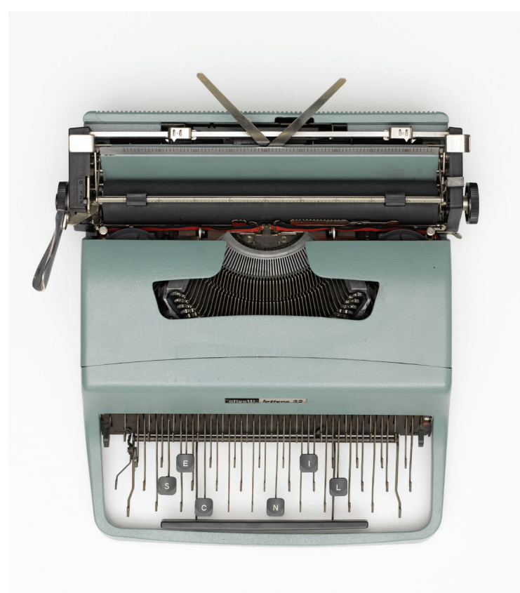
Múza, 2011, upravený psací stroj, 12 × 33 × 33 cm