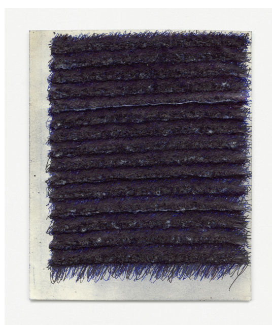
Deník, 2001, kuličkové pero na papíře, 15 × 18 cm