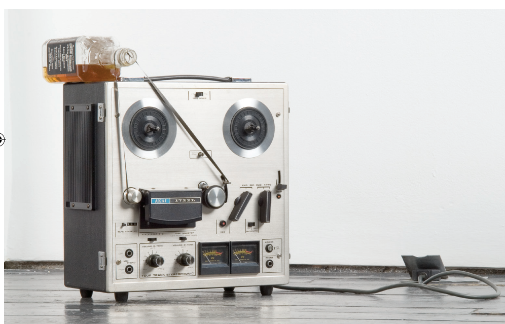
Nemiluješ mě, 2007, magnetofon, whisky, nalezený pásek, 40 × 36 × 26 cm