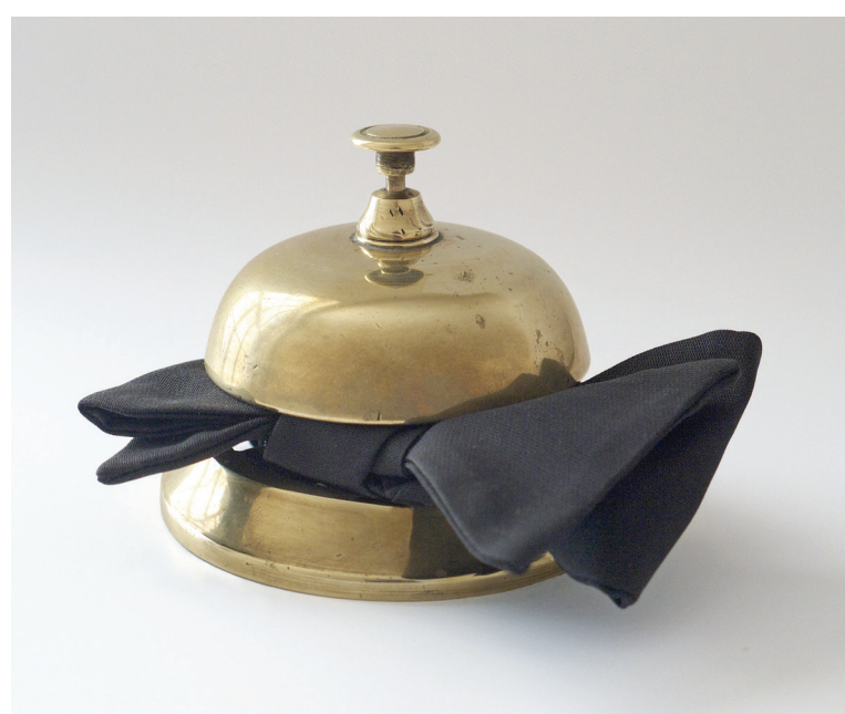
Une fois de plus —, 2015, mosazný recepční zvonek, hedvábný motýlek, 10 × 13 × 7,5 cm