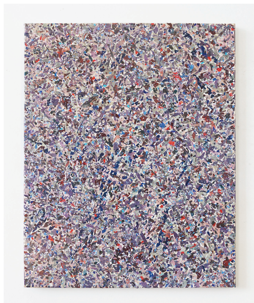
Nehotové obrazy EW270 (Miss Dors), 2023, recyklovaná barva na plátně, 122 × 154 cm