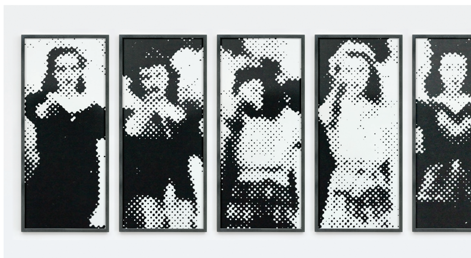
Portréty ze společnosti, 1988, 13 fotografií, každá 51 × 124 cm