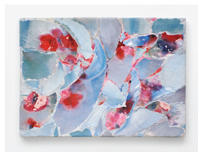
Moderní malby 20, 1997-2007, recyklovaná barva na plátně, 36,5 × 26,5 cm