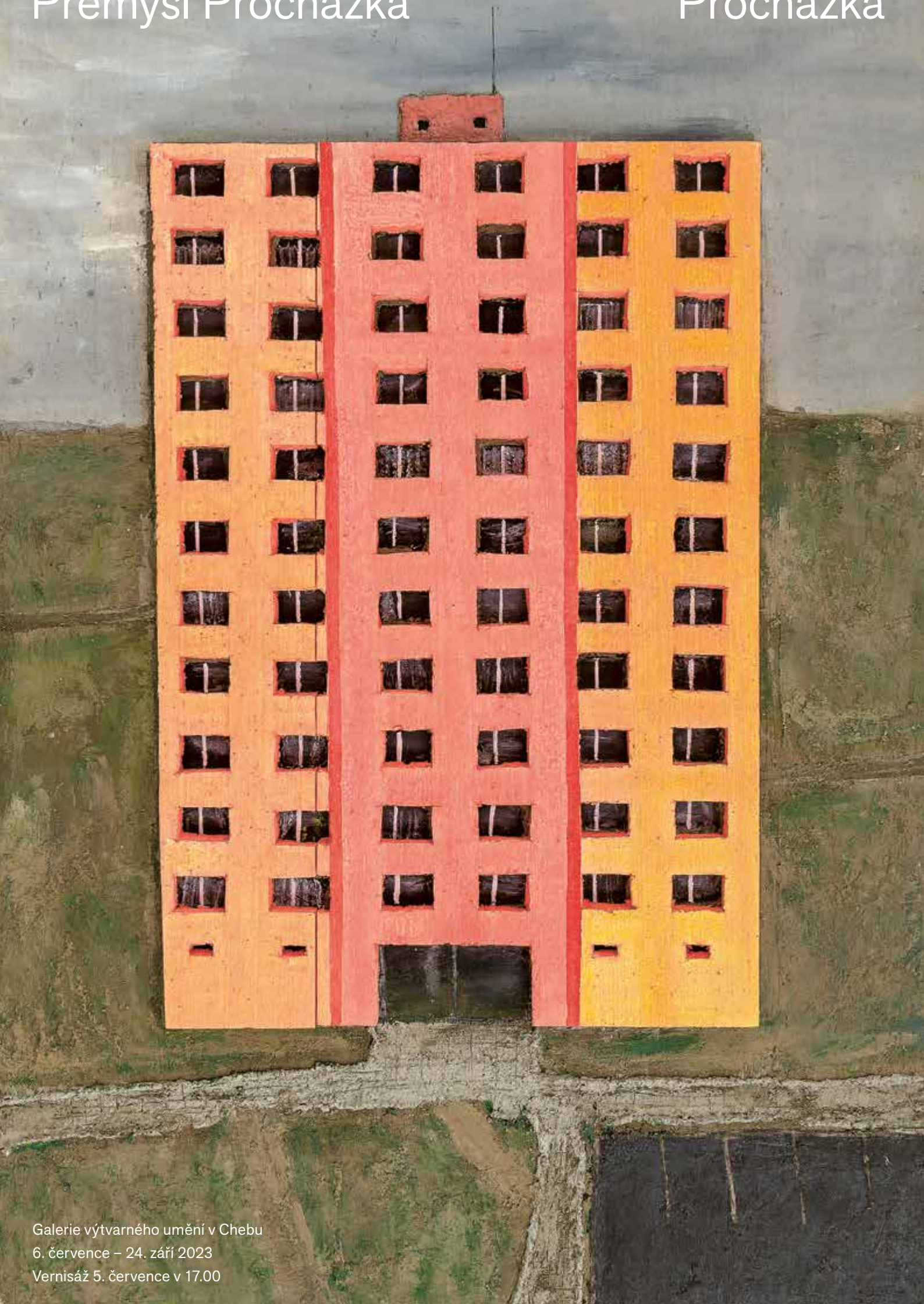
Galerie výtvarného umění v Chebu 6. července – 24. září 2023 Vernisáž 5. července v 17.00

Zateplený panelák, 2017, akryl, beton, asfalt a polystyren na plátně, 158 × 108 cm