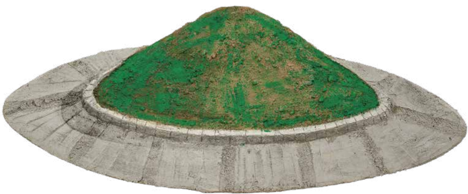
Kruhový objezd, 2023, beton, hlína a akryl na jutě, 46 × 114 cm