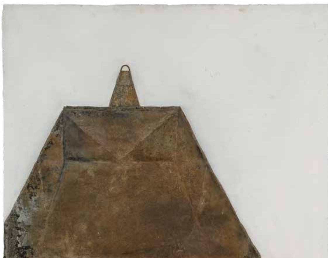
Kontejner, 2015, plech na plátně, 85,5 × 108,5 cm