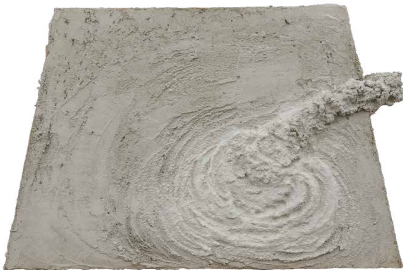
Lití základové desky, 2023, beton na jutě, 53 × 81 cm