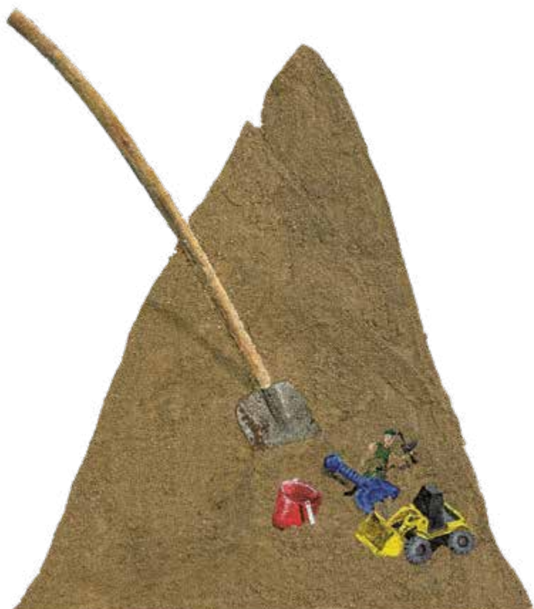
Hromada písku, 2023, písek a akryl na jutě, 126 × 110 cm