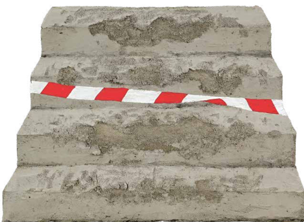
Schodiště v havarijním stavu, 2023, beton a akryl na jutě, 69 × 97,5 cm