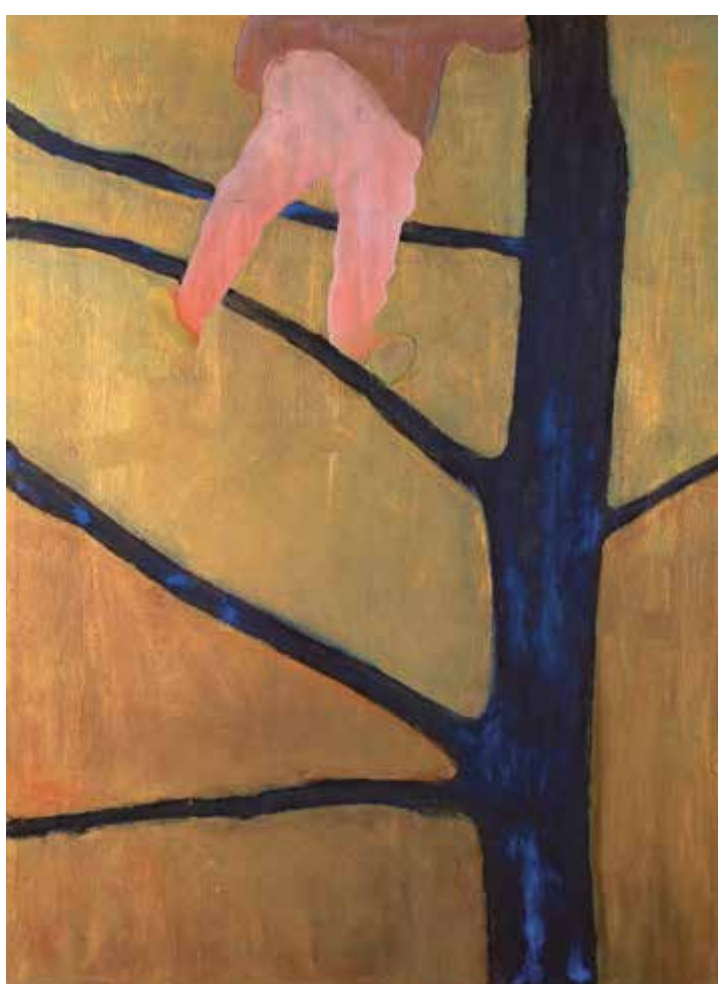
Přední strana / Front side: Trhání třešní / Cherry Picking, 2022, olej a suchý pigment na plátně / oil and dry pigment on canvas, 200 × 160 cm Ruce / Hands, 2022, olej na plátně / oil on canvas, 60 × 40 cm