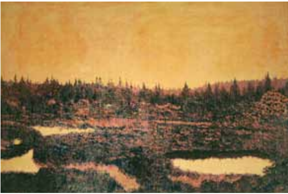
Oka slatí Neuhütten / Mooraugen in Neuhütten, 1931, barevný dřevoryt / farbiges Holzschnitt, 49 x 65 cm, z knihy Šumava umírající a romantická / aus dem Buch Böhmerwald sterbend und romantisch