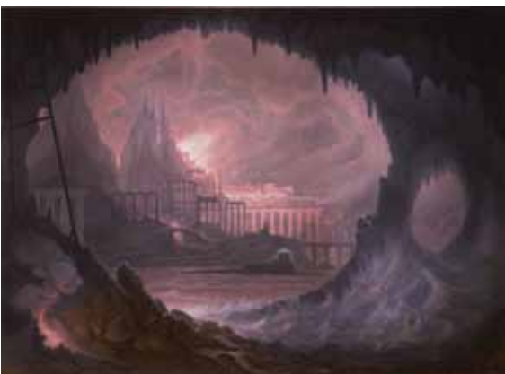
Platonova pomsta / Platons Rache, 2009, olej na plátně / Öl auf Lw., 218 × 300cm

Vernisáž: 2. března, cca 18.00 (po přednášce J. Kovandy)