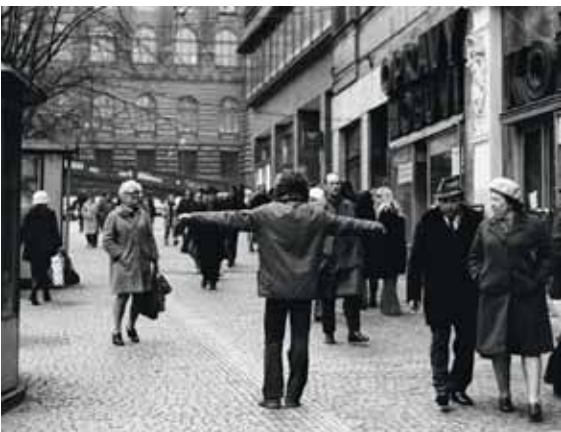
Bez názvu / ohne Titel, 19. 11. 1976, Praha, Václavské náměstí / Prag, Wenzelsplatz