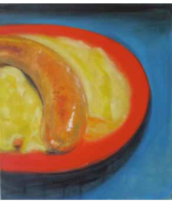
Jitřnice / Leberwurst, 1998, 80 x 70 cm, olej na plátně / Öl auf Lw.

23. února, 17.00, R. Wohlmut, přednáška o autorovi