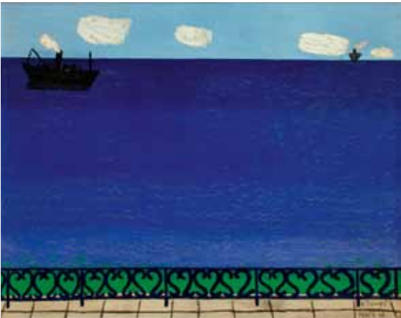
Karel Černý, Moře u Nice / Das Meer bei Nice, 1949, olej, plátno / Öl auf Lw., 80 × 100 cm

Výstavní sály 1. patro / Ausstellungsräume 1. St.