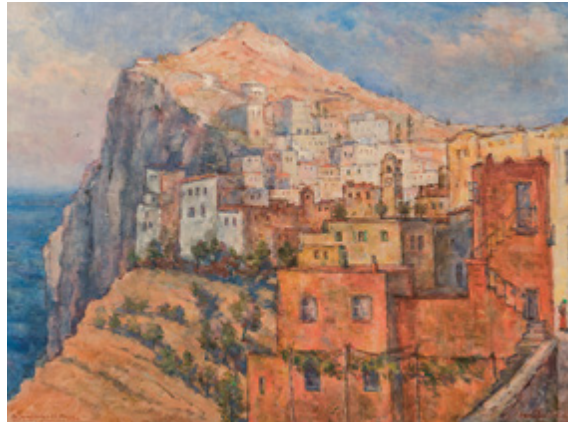
Jan Slaviček, Capri (Červený dům na Capri / Red House on Capri), 1951, olej na plátně / oil on canvas, 97 x 130 cm

GAVU – Výstava z deponitáře / Exhibition from the Depository 31. 8. 2022–30. 12. 2022 Kurátor / Curated by Barbora Popková