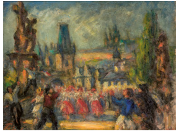
Friedrich Feigl, Pražský průvod / Prague Pageant, před / before 1944, olej na plátně / oil on canvas, 45 x 60 cm, soukromá sbírka / private collection

GAVU – Opus magnum 29. 9.– 30. 12. 2022 Kurátor / curated by Marcel Fišer Vernisáž ve středu 28. září v 17.00.