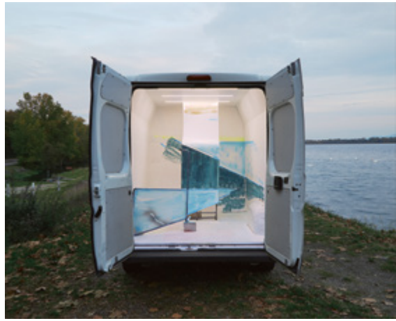
Outlines, dočasná instalace, Les Sept Ecluses, Francie (13/10/2020), N48.44968 / E7.74395, inkoustový tisk na dibondu, rámováno, 100 x 123 cm

GAVU – Malá galerie / Small Gallery 29. 9.– 4. 12. 2022 Kurátor / curated by Marcel Fišer Vernisáž ve středu 28. září v 17.00.