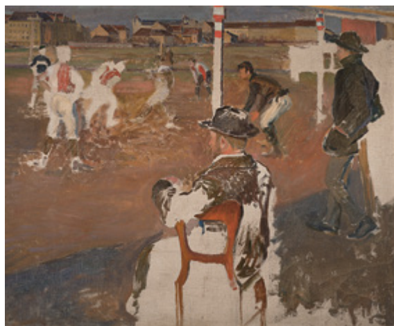
Miloš Jiránek, Fotbal (nedokončeno) / Football (unfinished), 1902, olej na plátně / oil on canvas, 68,5 x 82 cm, Národní galerie Praha

GAVU – Velká galerie / Great Gallery 29. 9.– 30. 12. 2022 Kurátor / curated by Marcel Fišer Vernisáž ve středu 28. září v 17.00. Ve středu 12. října v 17.00 komentovaná prohlídka s kurátorem výstavy. 9. listopadu v 17.00 přednáška historika sportu Martina Pelce „Muži v offsidu: fikce a realita prvorepublikového fotbalového fanouškovství“