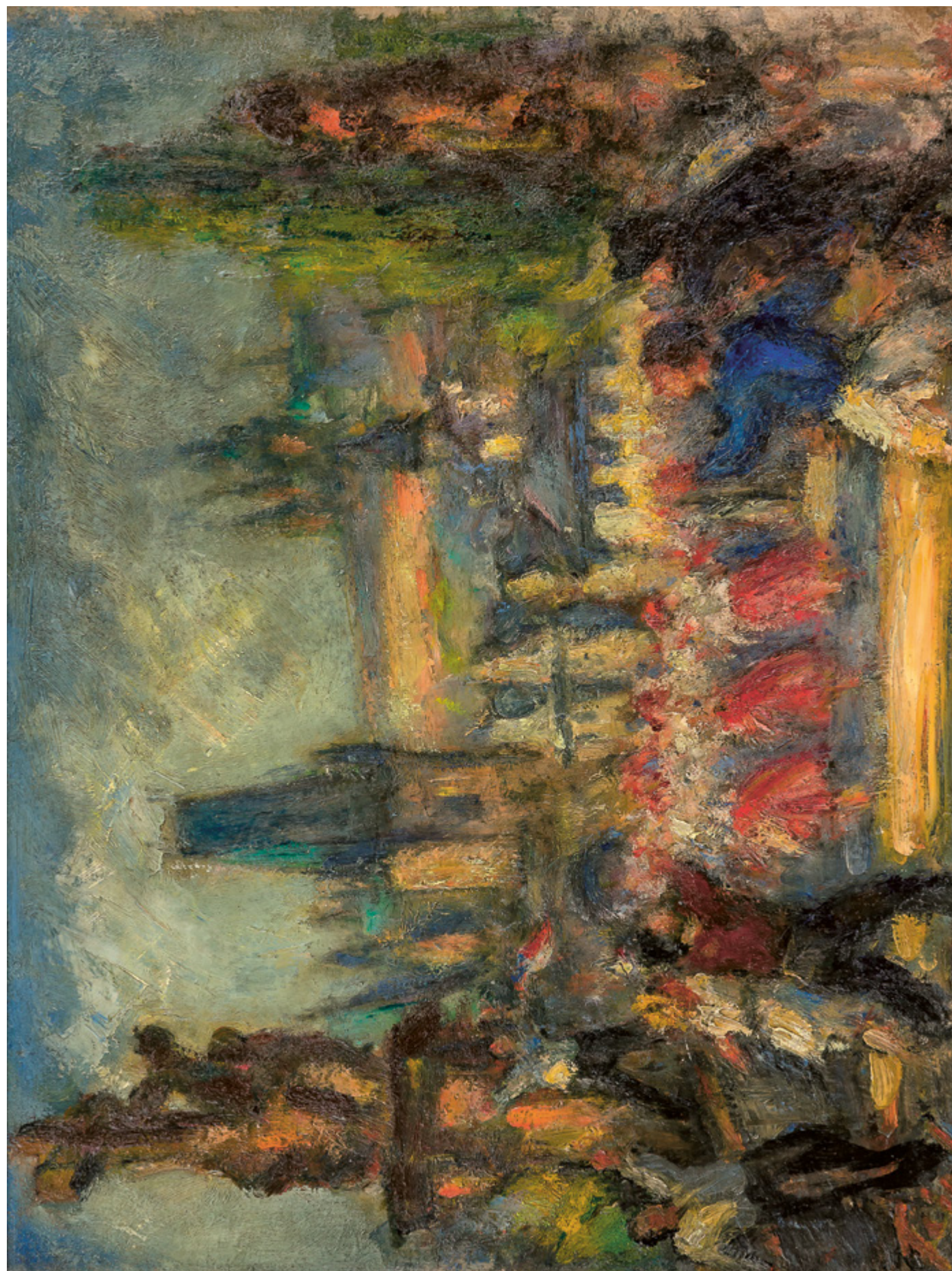
Friedrich Feigl, Pražský průvod, před 1944, olej na lepence, 45 × 60 cm, soukromá sbírka

no není z výstřížku patrné, se s Feiglem setkal u příležitosti výstavy k umělcovým šedesátinám. „ Před pěti lety vstoupili do Prahy Němci. Nejlepšího vylíčení této události, které jsem kdy slyšel, se mi včera v poledne dostalo od pana Feigla, umělce kdysi vítaného všude na Montmartru. [Zde autor naráží na to, že velká část krajin vystavených na této výstavě byly motivy z Montmartru.] V oslepující sněhové bouři viděl šiky pochodujících Němců s tvářemi postrádajícími jakýkoliv výraz poblíž starého Karlova mostu. Ticho čas od času přerušila pouze nízko letící letadla, jež několikrát těsně minula most. Brzy poté mu jeden přítel připomněl, že jejich umělecký klub nedávno vypsal subskripci na antifascistické účely. [V originále: „ raised a subscription for an antifascist purpose “]. Uměleckým klubem zde má zřejmě na mysli spolek Prager Secession, jehož předsedou v letech 1934–1939 Feigl byl.] Neměli bychom zajít na německé úřady a vysvětlit to?‘ zeptal se v ponurém žertu. Pan Feigl tehdy odpověděl, že to vysvětlí dopisem z Londýna. A tak i učinil. “ Po pasáži věnované fotbalu, k níž se dostaneme za chvíli, následuje závěrečná pasáž k obrazu Pražský průvod . Z ní plyne, že Feigl zamýšlel