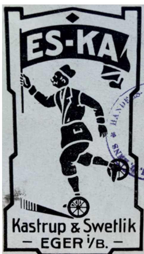
Ochranná známka „běhouna s vlnkou“ byla přihlášena 21. října 1911