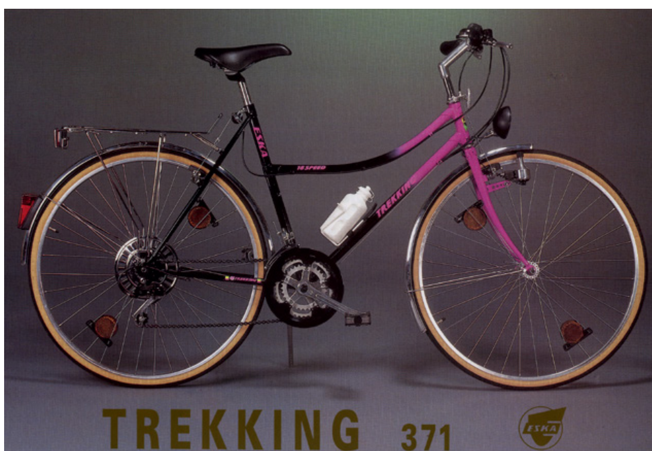
Trekingové kolo s trojřevodníkem, šestikolečkem a ovládním páčkami na řídítkách už Esku nezachránilo