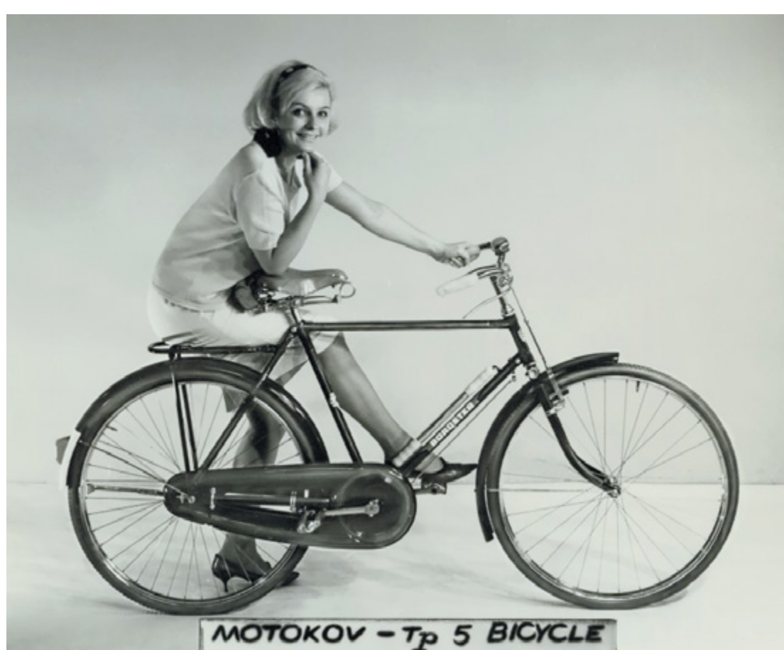
Pánské těžké cestovní kolo Tp5 na vývoz prezentovala modelka v sukni a v lodičkách