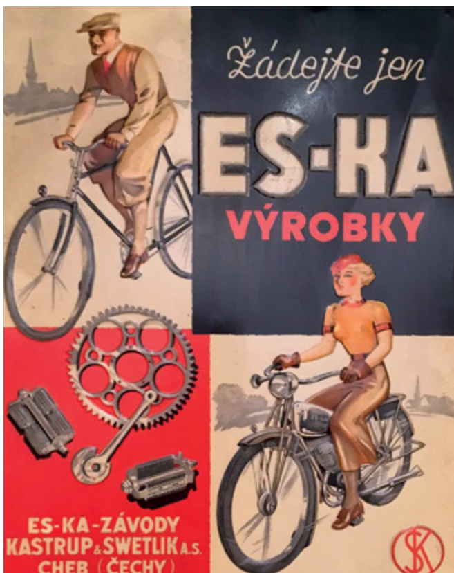
Reklamní tabule na originální náhradní díly, jejichž prodej byl výhodný obchod