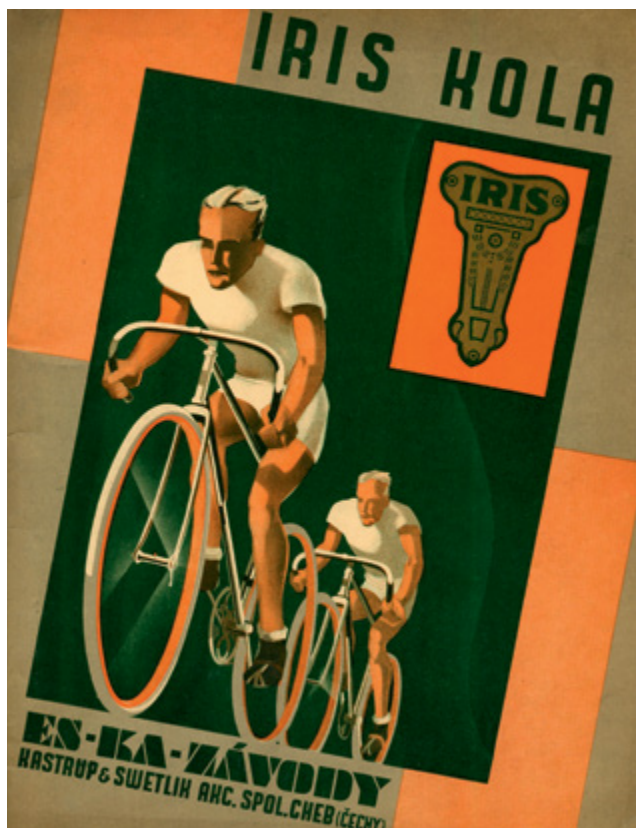
Iris byla po Esce druhou nejčastěji užívanou značkou. Titulní strana katalogu z roku 1933