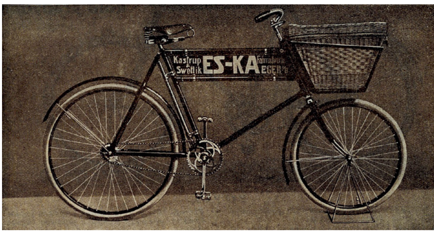
Eska Typ 70 bylo pevně stavěné rozvážkové kolo pro pekaře, cukráře a další živnostníky