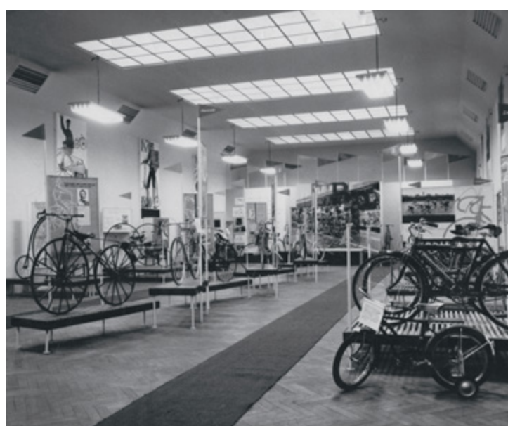
Výstavní síň Esky v proskleném pavilonu postaveném v roce 1968. Předválečné exponáty se po konci firmy „ztratily“, poválečné se dostaly do majetku města a jsou uloženy v depozitáři Muzea Cheb