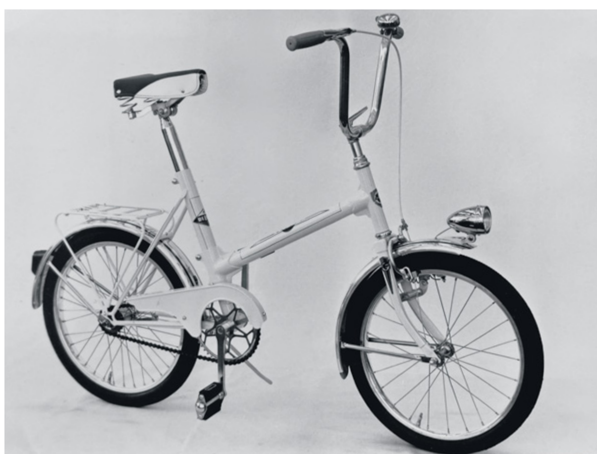
V roce 1965 vyrobili 6000 skládacích kol. Všechna se exportovala, na domácí trh nepřišlo ani jedno