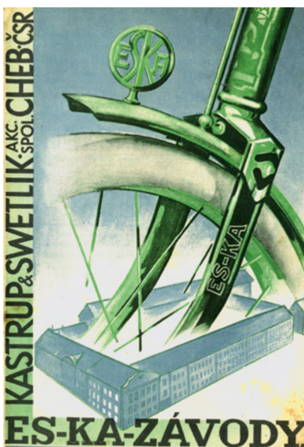
Titulní strana z katalogu kol na rok 1936